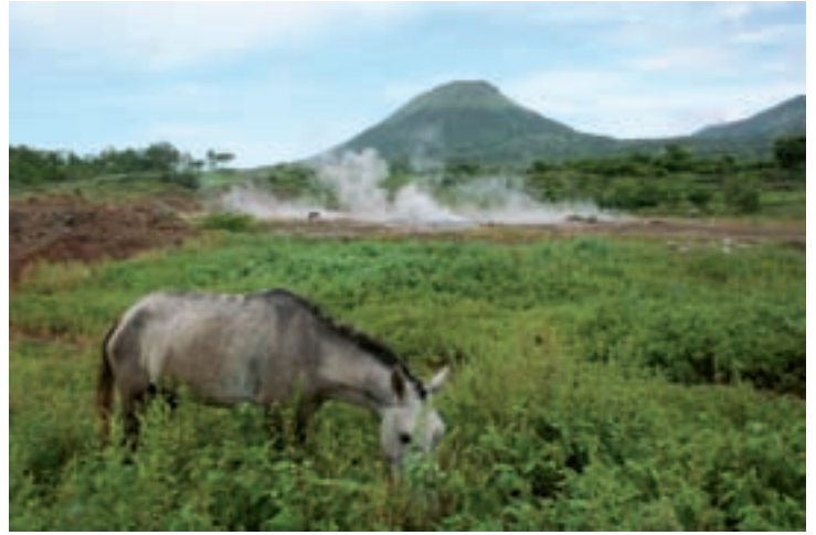
De vulkanische bronnen van San Jacinto in Nicaragua.

cultureel epicentrum van Midden-Amerika. Met een bezoek aan het nationaal park Masaya, enkele pittoreske marktjes, een bezoek aan de hete vulkanische bronnen van San Jacinto, de beklimming van de vulkaan Cerro Negra en een tweedaags verblijf in het natuurgebied en koffieplantage Selva Negra (500 ha virgin forest met o.m. een indrukwekkende kolonie brulapen), staat Nicaragua in geuren en kleuren in ons geheugen geprent.