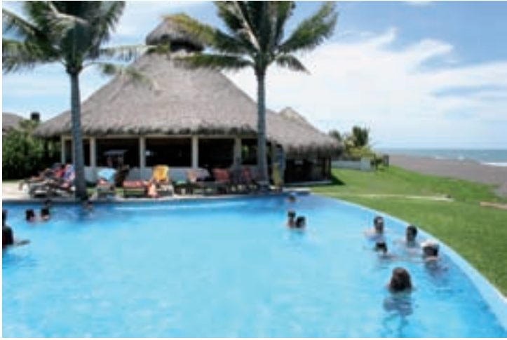
Dos Mundos in Monterrico, een ideale manier om even te verpozen na een indrukwekkende reis.